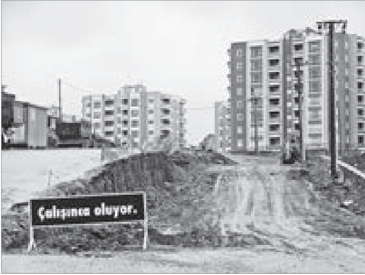
Toplu konutlarda evle iş arasında geçen izole hayatlar, İzmit'in bu yeni sakinlerinin kentle ilişkisinin tümünden kesilmesine neden oldu.

Özellikle 17 Ağustos 1999 depreminden sonra İzmit tepelere doğru genişlemeye başladı. Depremden alınan ders, dolgu bölgesi olan sahil alanlarının güvenli olmadığı yönündeydi. Toplu konut furyası başlayalı beri Dünya Bankası, Bayındırlık Konutları ve TOKİ konutlarının ardından Kocaeli Büyükşehir Belediyesi Kent Konut A.Ş. ve özel şirketlerin konut projeleriyle güne kadar bağ bahçe olan arazilerin büyük bir kısmı yerleşime açıldı. Böylece İzmit, kale surları gibi bir uçtan diğerine toplu konutlarla donatıldı. Toplu konutlarda ev ve iş arasında geçen izole hayatlar, İzmit'in bu yeni sakinlerinin kentle ilişkisinin tümünden kesilmesine neden oldu.