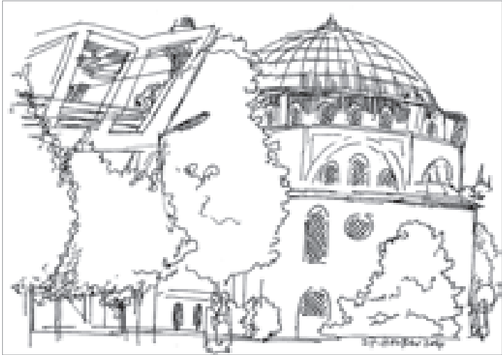
Mimar Sinan tarafından yapılan Yeni Cuma Camii'nin önu bir vakitler fayton durağıydı.

Mimar Sinan tarafından Mehmet Paşa'nın talebiyle yapılmış 1568 yılında başlanan Yeni Cuma Camii Külliyesi'nin inşaatı 1579'da tamamlanmış. Bu caminin D-100'e bakan cephesinde estetik yoksunluğunun timsali üstgeçidin uzantısı olan kocaman bir demir yığını yer alıyordu. Neyse ki mahkeme kararıyla yıkıldı. Şimdilerde SEKA Park ve Otogar arasında işleyen tramvay geçiyor Mimar Sinan Camii'nin arkasından.