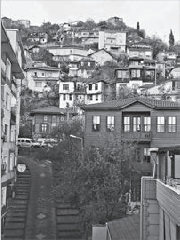
Merdivenler (Fotoğraf Pınar Özkan).

Mavinin, yeşilin, sarının, kırmızının değişik tonlarının, mevsimlerin bütün güzellik ve özelliklerinin zamanında yaşandığı, denizden bakıldığında, basamak basamak, sıra sıra, ahşap yapıları ve yemyeşil bitki dokusunun gözümüzü dolduran gönlümüze derin bir huzur veren o zamanın İzmit'ini bilen ve hatırlayan İzmitli kaybettiklerinden dolayı sonsuz acılar yaşamak-