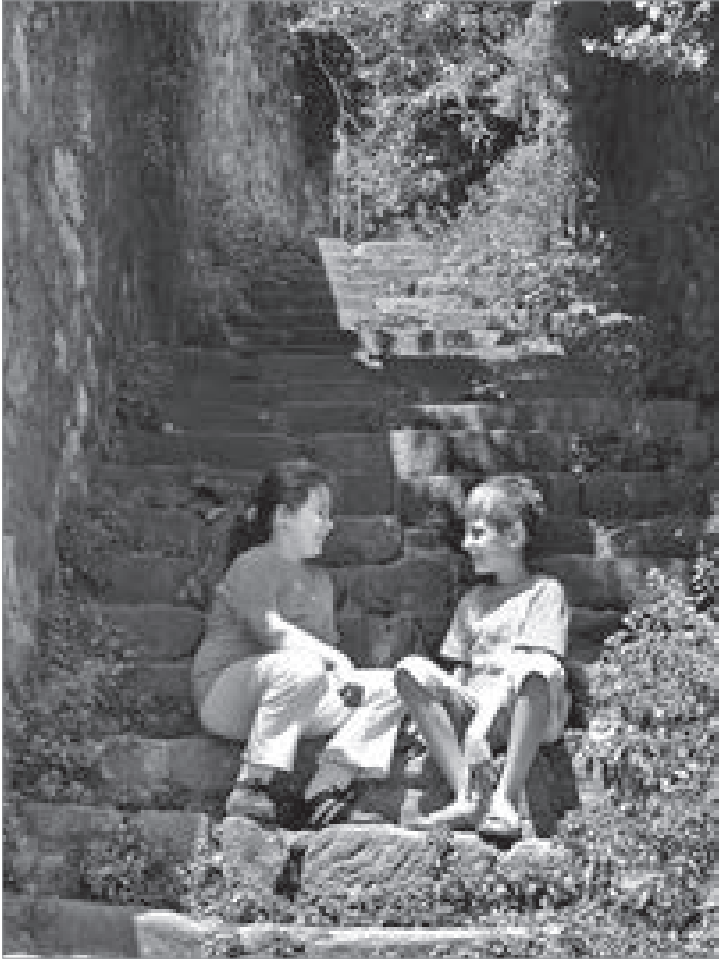
Yokuşlar (Fotoğraf Tuncay Bilecen).

rı, çevresini saran ağaçların dallarından görünmez olmuş, bazılarıysa çocuklar için oyun sahası haline gelmiş... Özellikle Turgut, Orhan, Veliahmet, Akçakoca, Kozluk, Çukurbağ, Topçular, Erenler mahallelerindeki ara sokaklarda, velhasıl Turan Güneş Caddesi ve İnönü Caddesi boyunca yukarıya doğru çıktığınızda her an o merdivenlerden biriyle karşılaşabilirsiniz. Sa-